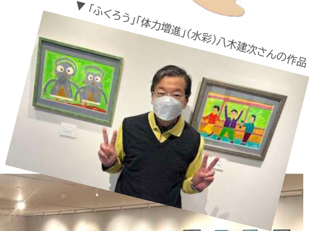
▼「ふくろう」「体力増進」(水彩)八木建次さんの作品