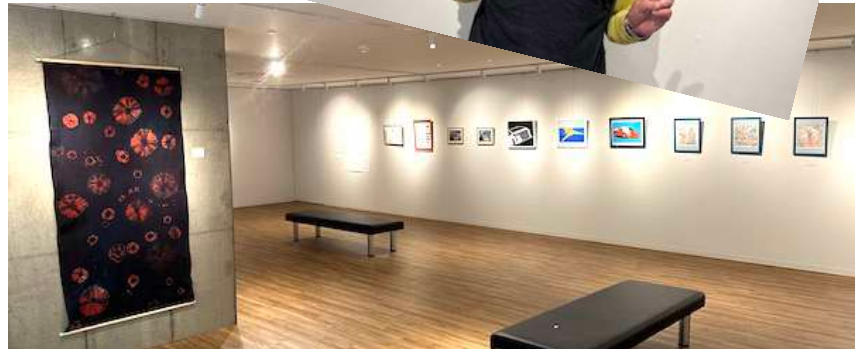
▲ 油彩・水彩・パステル・手工芸等、メンバーの作品 37点を展示しました。