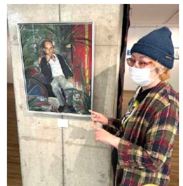
▲「THEN」(油絵) ぐら★さんの作品